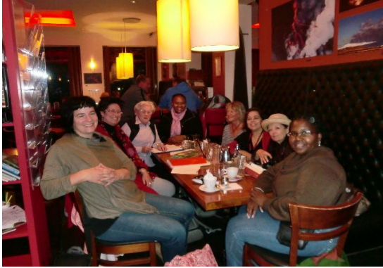
Arbeitsgruppe Kommunikationsstrategie: wo sonst als im Cafè Paris ?!

Betreffend Fundraising sollten Webseiten wie 1%-Club.nl oder mySherpas.com genutzt werden, wo man Projekte, die zu finanzieren sind, vorstellt und wartet, bis die Summe gesponsert ist.