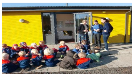
Jungen beim Peer-Working