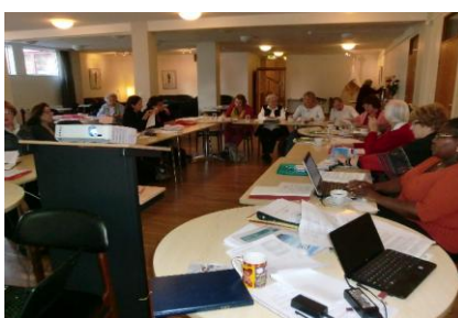
Keine Sitzung ohne helfende Technik + ...