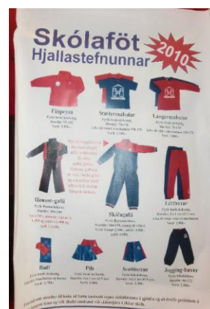
Uniform für alle- kein Rosa!