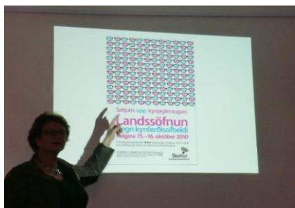
Aktion Gender-Brille in Island

Gastgeberin: Kvenréttindafélag Ísland (Isländischer Frauenrechts Verband). Er wurde am 27. Jan. 1907 gegründet. Zunächst kämpfte der Verband für das Wahlrecht der Frauen, das 1915 für Frauen mit 40 und älter gewährt wurde. Der Tag der Unterschrift unter dieses Gesetz, der 19. Juni, wird bis heute von Islands Frauen gefeiert. Das Verbandsmagazin ist nach diesem Tag benannt „19. Júní“ und wird seit 1951 herausgegeben. Es ist das älteste Magazin in Island. Heute arbeitet der Verband gegen alles, was der Gleichberechtigung zwischen Mann und Frau im Wege steht. Er bestärkt vor allem die ins Parlament und in die Gemeinden Gewählten und fordert Gender Balance in Führungspositionen öffentlicher und privater Unternehmen durch Quoten ein. Gewalt gegen Frauen, Prostitution, Frauenhandel sowie die immer noch bestehende Lohnungleichheit nehmen breiten Raum der Sorge und Arbeit ein. Ziel des Verbands ist die Abschaffung der Ungleichheit auf allen Ebenen. Am ersten Abend zeigten uns die Gastgeberinnen eine Präsentation von einer eindrucksvollen Demonstration eines Frauenstreiks gegen das Gender Pay Gap. Sie betonten, dass neben aller Arbeit und Aktion auch immer gefeiert und gelacht werden müsse und verteilten „Gender-Brillen“.