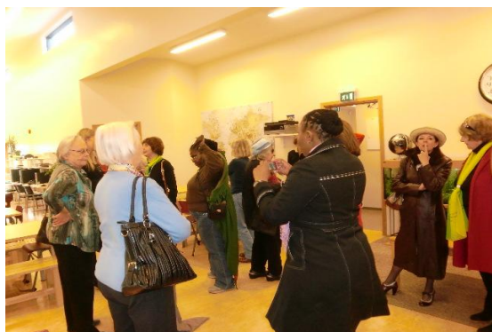
IAW Vorstandstreffen in Hjalli-Vorschule

Die erste war ein „Hjalli-Model“-Kindergarten mit Vorschule nach dem Konzept der Gründerin Margrét Pála Ólafsdóttir. 1989 gründete die Pädagogin und Vorschullehrerin die erste Einrichtung. 2002 eine weitere. Heute werden 500 Kinder in 13 Vor-Schulen unterrichtet. Das einzigartige ist die bewusst weitgehend geschlechtergetrennte Erziehung (in Jungen- und Mädchenräumen) mit gezielter Zusammenführung beider. Kurz gesagt wird auf die zweigeschlechtlichen Besonderheiten mit einer genderspezifischen Contraintervention geantwortet, um Rollenstereotype abzubauen. Jungen lernen körperlichen Kontakt zu anderen Jungen, Aufmerksamkeit, Konzentration, Partnerarbeit (zu zweit als Peer zu lernen), die Mädchen haben Raum und werden ermutigt, Raum und Stimme zu ergreifen, auszuweiten etc. Es gibt keine Funktionsräume (Küche, Technikecke etc.).